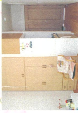
1人居室が15部屋の定員15人の施設です。居室、廊下は車椅子での生活も可能です。お部屋にはキッチン・収納ダンス・ベッド・トイレ等があります。