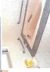
入浴には男女の浴室があります。